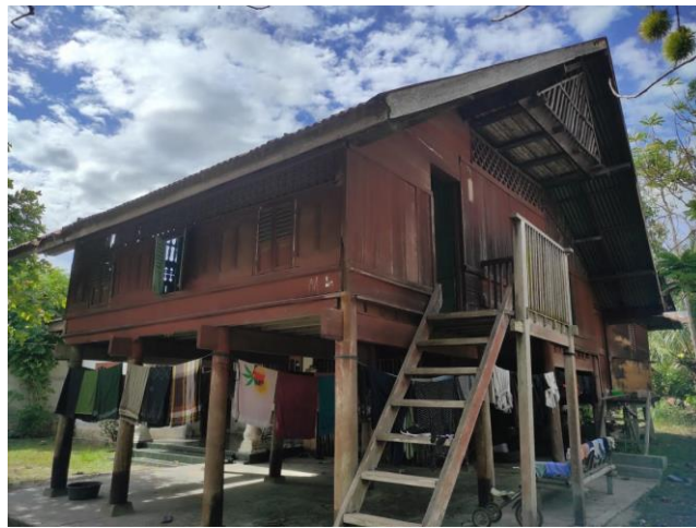
Gambar 1. Tampilan depan rumah tradisional Aceh di desa Lubok Sukon

Rumah tradisional Aceh merupakan rumah adat yang dibangun berdasarkan filosofi, adat istiadat, budaya dan keyakinan masyarakat Aceh. Ajaran agama Islam sangat berpengaruh dalam setiap lini kehidupan masyarakat Aceh sehingga desain rumah tradisional Aceh didasari atas nilai-nilai dan prinsip keislaman.