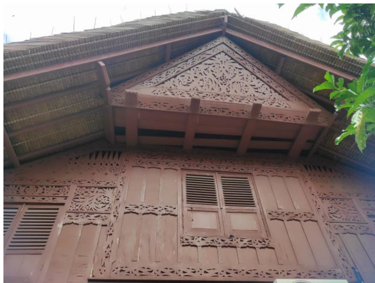
Gambar 3. Tulak angen berbentuk segitiga yang berfungsi sebagai lubang ventilasi

Pada rumah tradisional Aceh terdapat elemen yang bernama ‘Tulak Angen’. Tulak Angen merupakan lubang ventilasi, dimana angin bisa keluar dan masuk ke dalam bangunan. Tulak Angen terdapat pada bagian atas sisi dinding rumah dan berbentuk segitiga. Tulak Angen memiliki ornamen yang sarat akan agama Islam. Ornamen yang terdapat pada Tulak Angen biasanya bertuliskan kaligrafi Arab dan motif bulan dan bintang. Bulan dan bintang merupakan simbol yang melambangkan syariat agama Islam. Simbol bulan dan bintang sendiri kerap kali dijumpai pada bagian atas kubah bangunan mesjid. Selain pada bagian Tulak Angen, ukiran kaligrafi juga sering kali dijumpai pada bangunan rumah tradisional Aceh. Penggunaan ornamen dan ukiran kaligrafi ini memperlihatkan suatu pengingat terhadap Allah SWT, dan sesuai dengan kaidah arsitektur Islam.