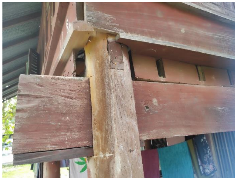
Gambar 4. Struktur kayu dengan teknik yang saling mengunci

Secara kontekstual, rumah tradisional aceh dibangun dengan menggunakan material alami yang tumbuh di sekitarnya. Penutup atap nya adalah daun rumbia yang memang sesuai karena tumbuhan ini berbobot ringan dan dapat bertahan hingga 4 tahun. Karakteristik tumbuhan ini juga sangat baik dalam mengurangi radiasi matahari sehingga suhu dalam rumah tetap nyaman di hari yang cerah. Selain itu, konstruksi rumah secara keseluruhan terbuat dari kayu dan bambu. Menariknya, rumah tradisional Aceh tidak menggunakan paku atau besi, melainkan setiap elemen kayu dan bambu tersebut disusun dengan teknik yang saling mengunci sehingga tercipta konstruksi yang saling terikat dan kokoh.